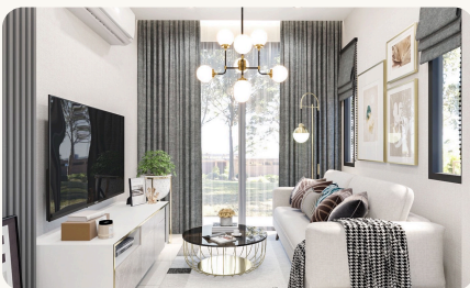
ห้องนั่งเล่น